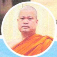
พระราชวังธสารบัณฑิต, ศ.ดร. รองอธิการบดี ฝ่ายวางแผนและพัฒนา มหาวิทยาลัยมหาจุฬาลงกรณราชวิทยาลัย