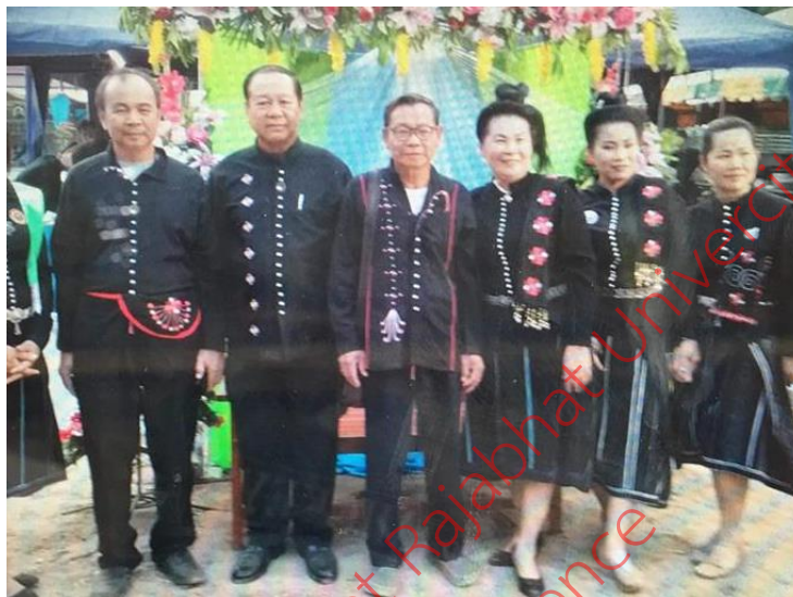
ภาพที่ 2 การแต่งกายของชาวไทยทรงดำในหมู่บ้านวังอ้อ

หม่อนเลี้ยงไหม เพื่อผลิตเส้นใยและย้อมสีผ้าด้วยต้นคราม ซึ่งผู้หญิงจะทำหน้าที่ในการตัดเย็บ แต่ในปัจจุบัน การแต่งกายของชาวไทยทรงดำมีการเปลี่ยนแปลงตามยุคสมัยมาสวมใส่เสื้อผ้าของชาวไทย เพราะสามารถหาซื้อได้ง่าย และมีราคาถูกกว่าชุดของไทยทรงดำ นอกจากนี้เหตุผลที่ชาวไทยทรงดำไม่นิยมใส่ชุดไทยทรงดำเพราะต้องการให้มีความกลมกลืนกับคนไทยทั่วไป