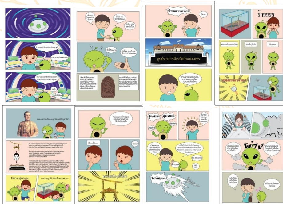
ภาพที่ 8 แสดงเนื้อเรื่องการ์ตูนสำหรับเด็ก “ลููก้า ตะลุย คำขวัญกำแพงเพชร” ที่ผ่านการปรับปรุงแก้ไข ตามข้อเสนอแนะของผู้ทรงคุณวุฒิด้านการออกแบบ

ผู้วิจัยจึงได้นำข้อเสนอแนะจากผู้ทรงคุณวุฒิด้านการออกแบบ มาออกแบบปรับปรุงการ์ตูนสั้นจากคำขวัญ จังหวัดกำแพงเพชร ให้มีความเหมาะสมยิ่งขึ้นจากคำแนะนำของผู้ทรงคุณวุฒิ ดังภาพที่ 8