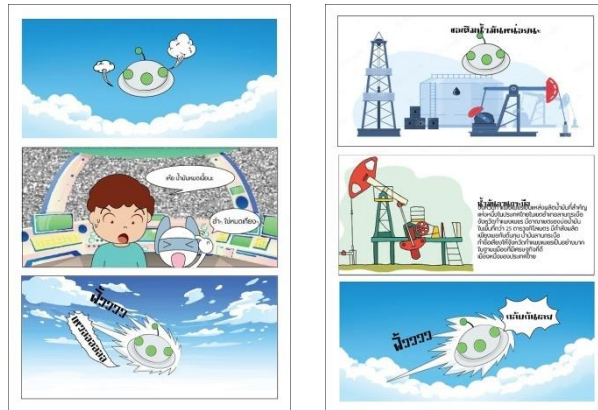
ภาพที่ 6 แสดงเนื้อเรื่องการ์ตูนสำหรับเด็กในตอนเปิดเรื่อง ลูก้าและเจ๋งได้บินกลับบ้านนั้นยานบินพลังงานหมดจึงต้องการพลังเชื้อเพลิงเป็นจำนวนมากเจ๋งจึงแนะนำให้ไปที่อำเภอลานกระบือเพราะที่นั่นมีพลังงานเชื้อเพลิงเป็นจำนวนมาก ลูก้าจึงลงจอกยานบินและเติมเชื้อเพลิง ลูก้าจึงถามเจ๋งว่าเจ๋งรู้ได้อย่างไรที่อำเภอลานกระบือมีพลังงานจึงอธิบายให้ลูก้าฟังว่าที่ลานกระบือเป็นแหล่งน้ำมันส่งออกเป็นอันดับของประเทศไทย เติมเชื้อเพลิงเสร็จทั้งสองจึงได้ขับยานบินกลับ