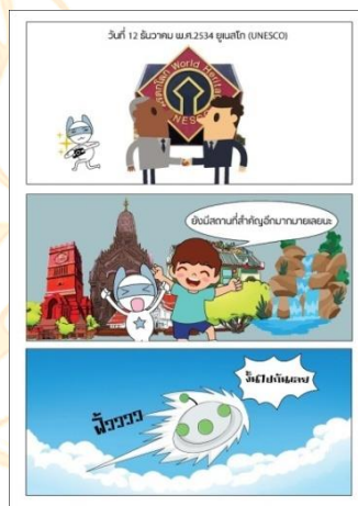
ภาพที่ 7 แสดงเนื้อเรื่องการ์ตูนสำหรับเด็กในตอนเปิดเรื่อง ลูก้าและเจ๋งได้บินย้อนไปในตอนที่กำแพงเพชรได้ถูกยอมรับเป็นเมืองมรดก ของ(UNESCO) ลูก้าจึงได้ถ่ายรูปเป็นที่ระลึก เมื่อไปสำรวจคำขวัญจังหวัดกำแพงเพชรจนหมด เจ๋งจึงได้แนะนำลูก้าไปว่ายังมีสถานที่สำคัญและน่าสนใจอีกมากมาย ทั้งสองจึงได้ไปสำรวจที่อื่นกันต่อไป