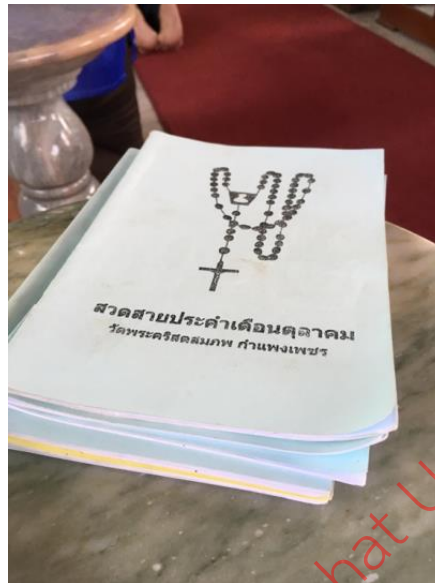
ภาพที่ 5 หนังสือสวดมนต์