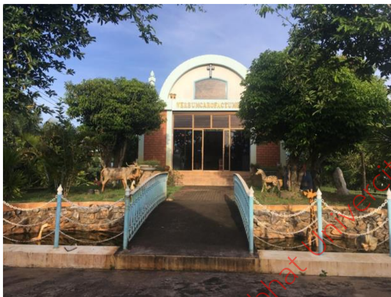
ภาพที่ 2 วัดพระคริสต์สมภพ จังหวัดกำแพงเพชร