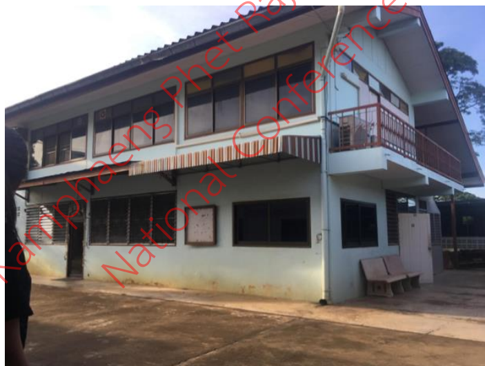
ภาพที่ 3 บ้านพักในวัดพระคริสต์สมภพ