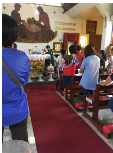
ภาพที่ 4 การเข้าพิธีมิสซาบูชา