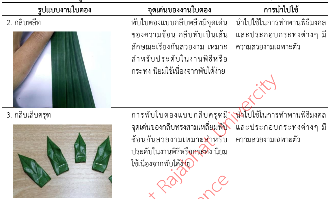
ตารางที่ 1 ผลการวิเคราะห์รูปแบบอัตลักษณ์ศิลปะสร้างสรรค์งานใบตอง เพื่อใช้ในการออกแบบ (ต่อ)

ผลการวิเคราะห์ข้อมูลแบบสอบถามความต้องการของกลุ่มผู้ผลิต กลุ่มตัดเย็บ กลุ่มจัดจำหน่ายเกี่ยวกับแนวทางที่มีต่อการพัฒนาชุดสำหรับสตรี มีผลการวิเคราะห์ ดังนี้