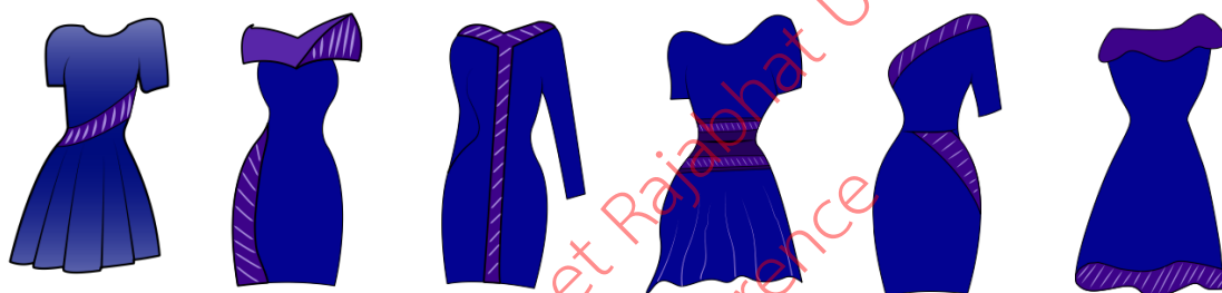
ภาพที่ 1 รูปแบบชุดลำลอง

ผู้วิจัยได้ออกแบบชุดสำหรับสตรีจำนวน 3 รูปแบบ คือ ชุดลำลอง ชุดเดรส ชุดราตรียาว โดยใช้รูปแบบด้านอัตลักษณ์ศิลปะสร้างสรรค์งานใบตองที่ได้รับการคัดเลือกจากการประเมินรูปแบบจากผู้เชี่ยวชาญ คือ กลีบหัดค้อม้า กลีบพลีท กลีบเล็บครุฑ และโดยใช้ผลการวิเคราะห์ข้อมูลแบบสอบถามความต้องการของกลุ่มผู้ผลิตกลุ่มตัดเย็บ กลุ่มจัดจำหน่าย เป็นแนวทางที่มีต่อการพัฒนาชุดสำหรับสตรีเป็นแนวคิดในการออกแบบ ผู้วิจัยได้ทำการออกแบบทั้งหมด 18 ชุด ดังนี้