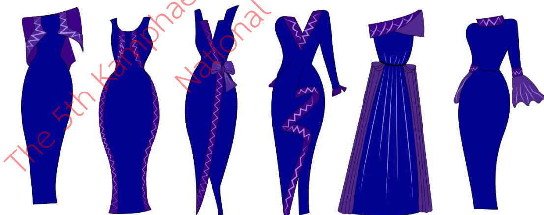
ภาพที่ 2 รูปแบบชุดเดรส