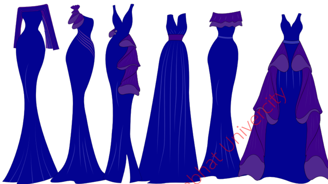
ภาพที่ 3 รูปแบบชุดราตรียาว

ผลการวิเคราะห์การสัมภาษณ์ผู้เชี่ยวชาญด้านการออกแบบชุดสำหรับสตรี จากอัตลักษณ์ศิลปะสร้างสรรค์งานสู่การออกแบบสตรีในสมัยนิยม