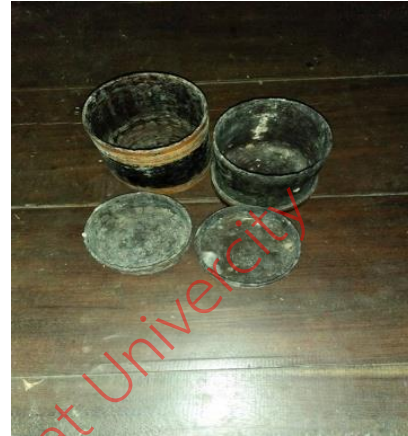
ภาพที่ 1 โกล๊ะ และ กระโตะ