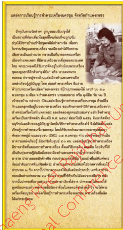
ภาพที่ 2 รูปแบบที่ 2 เนื้อหาด้านข้อมูลประชาสัมพันธ์