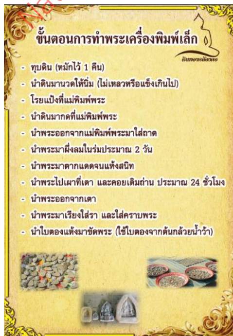
ภาพที่ 3 รูปแบบที่ 3 เนื้อหาด้านข้อมูลการทำพระเครื่อง