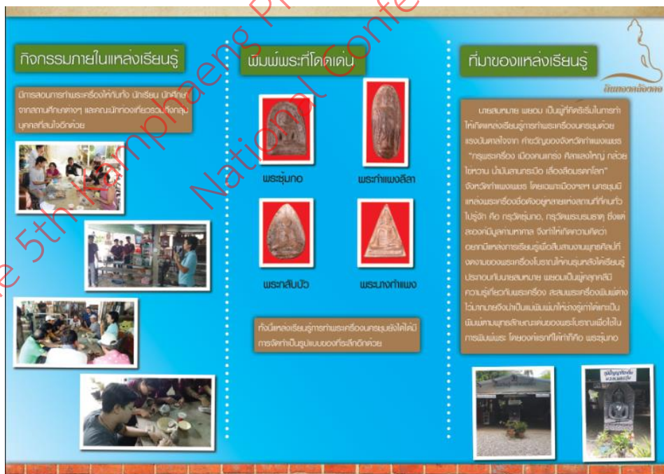
ภาพที่ 5 รูปแบบที่ 5 เนื้อหาด้านจุดเด่น ความสำคัญต่างๆ เพื่อนำมาใช้ในการทำแผ่นพับ

จากการประเมินรูปแบบการออกแบบสื่อประชาสัมพันธ์ สำหรับแหล่งเรียนรู้การทำพระเครื่องนครชุม โดยผู้เชี่ยวชาญด้านข้อมูลเนื้อหา จำนวน 3 ท่าน เพื่อการพัฒนาแบบสื่อประชาสัมพันธ์ สำหรับแหล่งเรียนรู้การทำพระเครื่องนครชุม ให้มีความเหมาะสม โดยผู้วิจัยได้ข้อสรุปตามกรอบแนวคิดในการวิจัย ดังต่อไปนี้