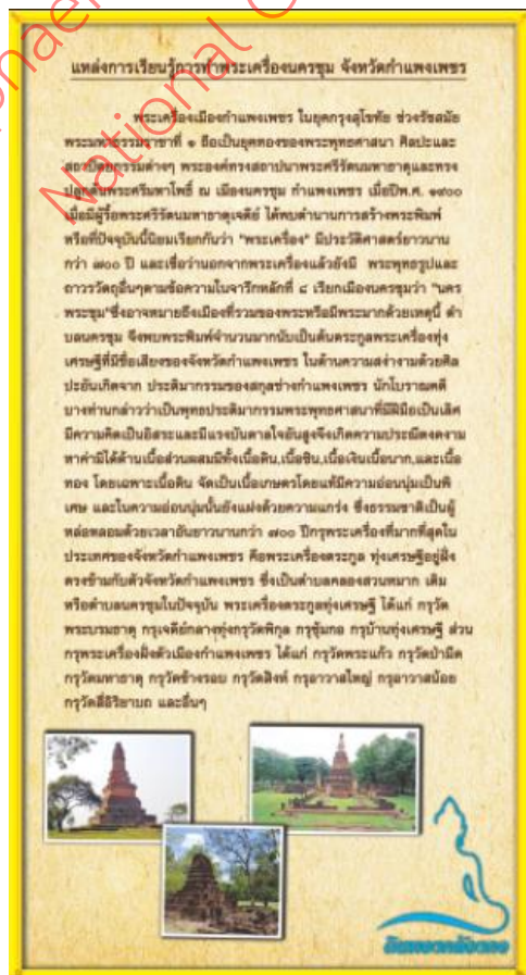
ภาพที่ 1 รูปแบบที่ 1 เนื้อหาด้านประวัติความเป็นมา

ผู้วิจัยได้ดำเนินการออกแบบสื่อประชาสัมพันธ์สำหรับแหล่งเรียนรู้การทำพระเครื่องนครชุม จำนวน 5 รูปแบบ ดังภาพที่ 1 - 5