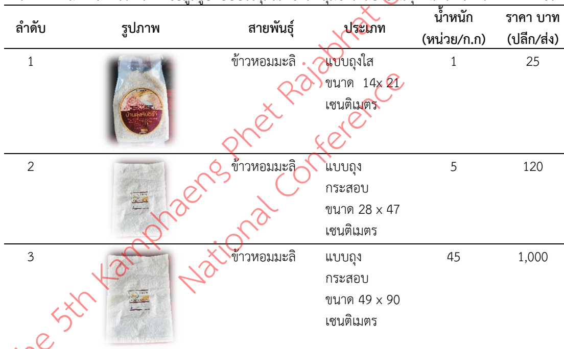
ตารางที่ 1 แสดงผลการวิเคราะห์ข้อมูลรูปแบบบรรจุภัณฑ์ข้าว กลุ่มข้าวกล้องบ้านทุ่งหันตรา จังหวัดกำแพงเพชร

ผลจากการสัมภาษณ์โดยผู้วิจัยได้ใช้แบบสัมภาษณ์แบบมีโครงสร้าง เพื่อการสัมภาษณ์ตัวแทนกลุ่มข้าวกล้องบ้านทุ่งหันตรา จังหวัดกำแพงเพชร จำนวน 5 ท่าน ตามกรอบแนวคิดด้านการออกแบบสิ่งพิมพ์บรรจุภัณฑ์พบว่า