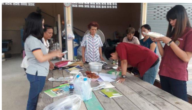
ภาพที่ 1. การสัมภาษณ์โดยผู้วิจัยใช้แบบสัมภาษณ์แบบมีโครงสร้าง ตัวแทนกลุ่มข้าวกล้องบ้านทุ่งหันตรา จังหวัดกำแพงเพชร จำนวน 5 ท่าน

ด้านการปกป้องผลิตภัณฑ์ข้าว พบว่า ตัวแทนกลุ่มข้าวกล้องบ้านทุ่งหันตรา จังหวัดกำแพงเพชร มีความเห็นสอดคล้องกันว่า การออกแบบบรรจุภัณฑ์และหีบห่อบรรจุข้าวต้องสามารถปกป้องสินค้าภายในให้อยู่ในสภาพดีได้ การป้องกันความแตกหักของข้าว ป้องกันความชื้นของข้าวให้คงอยู่ในสภาพที่ดีอยู่ตลอดเวลา บรรจุภัณฑ์ที่มีความแข็งแรง ทนทาน และมีความเหมาะสมของการขนส่งที่ดี รวมทั้งจะต้องมีต้นทุนในการผลิตให้ต่ำที่สุด เพื่อจะได้มีกำไรจากการขายให้มากที่สุด การเปิด - ปิด สะดวก สบาย และดูมีคุณภาพมากที่จะสื่อให้เห็นถึงคุณภาพของผลิตภัณฑ์ภายในว่ามีมาตรฐานที่ดี จะช่วยในการสร้างมูลค่าให้แก่ตัวผลิตภัณฑ์มากขึ้น