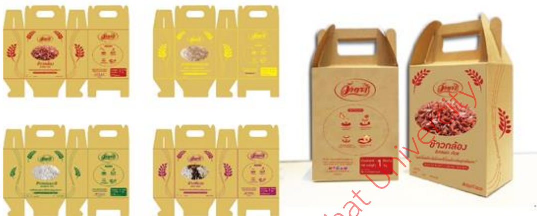
ภาพที่ 2 แบบร่างชุดผลิตภัณฑ์ข้าววังตรา รูปแบบที่ 1 ขนาด 1 กิโลกรัม