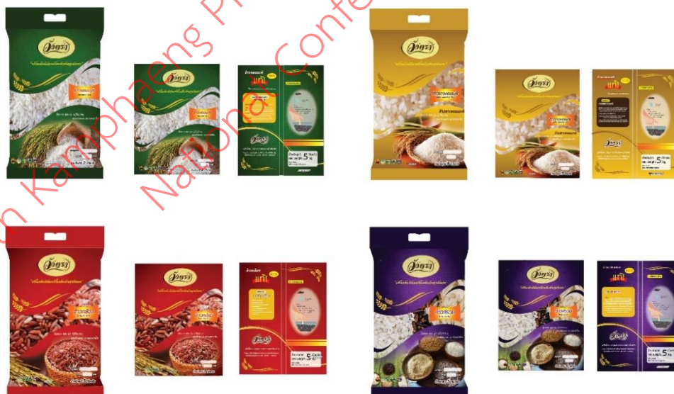
ภาพที่ 3 แบบร่างชุดผลิตภัณฑ์ข้าว วังตรา รูปแบบที่ 2 ขนาด 5 กิโลกรัม