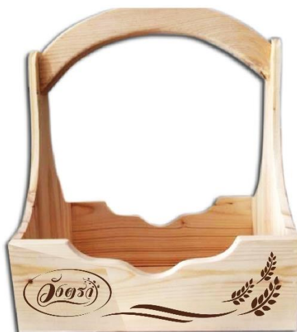
ภาพที่ 6 แบบร่างชุดผลิตภัณฑ์ข้าววังตรา รูปแบบที่ 5 บรรจุภัณฑ์แบบรวมข้าว 4 ชนิด