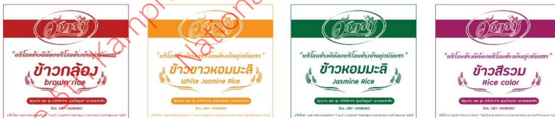
ภาพที่ 5 แบบร่างชุดผลิตภัณฑ์ข้าววังตรา รูปแบบที่ 4 บรรจุภัณฑ์ข้าวสวยหุงสำเร็จ