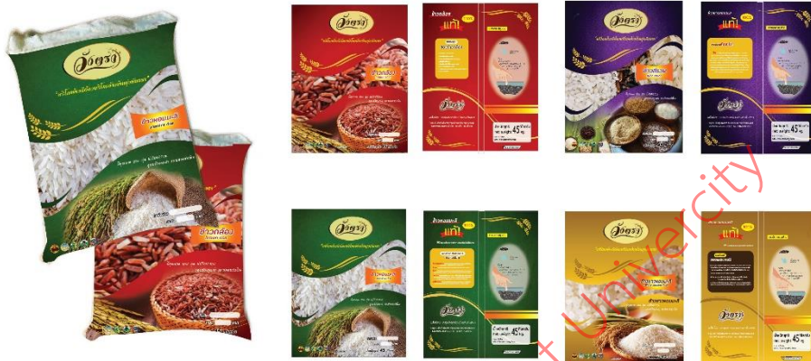
ภาพที่ 4 แบบร่างชุดผลิตภัณฑ์ข้าววังตรา รูปแบบที่ 3 ขนาด 45 กิโลกรัม