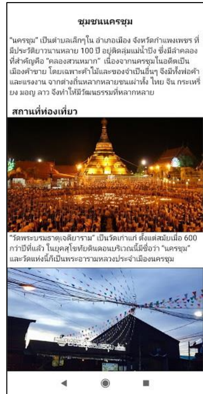
ภาพที่ 2 หน้าชุมชนนครชุม