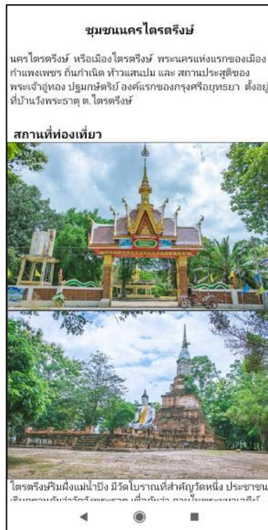
ภาพที่ 3 หน้าชุมชนนครไตรตรึงษ์