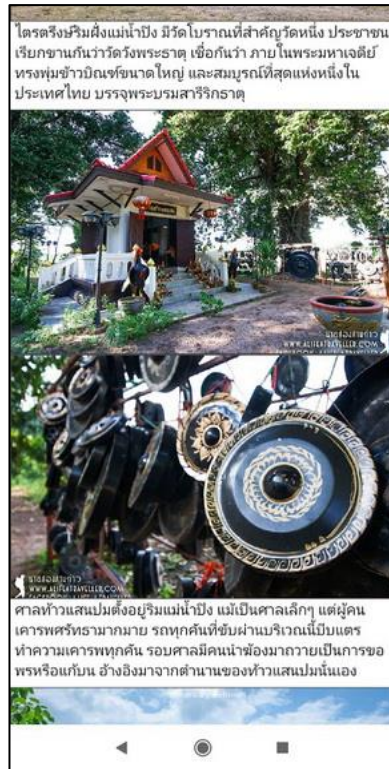
ภาพที่ 5 ตัวอย่างรายละเอียด