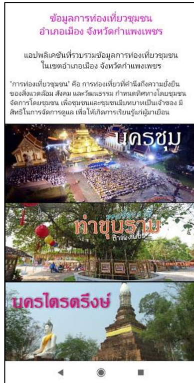
ภาพที่ 1 หน้าหลักของแอปพลิเคชัน