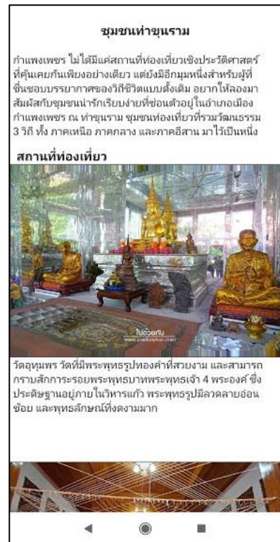
ภาพที่ 4 หน้าชุมชนท่าขุน