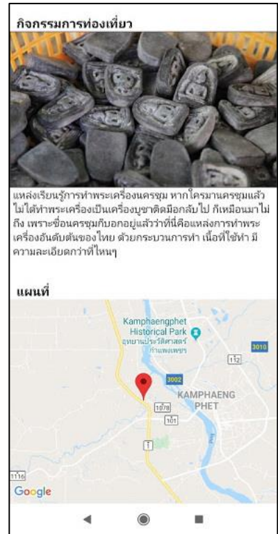
ภาพที่ 6 ตัวอย่างแผนที่