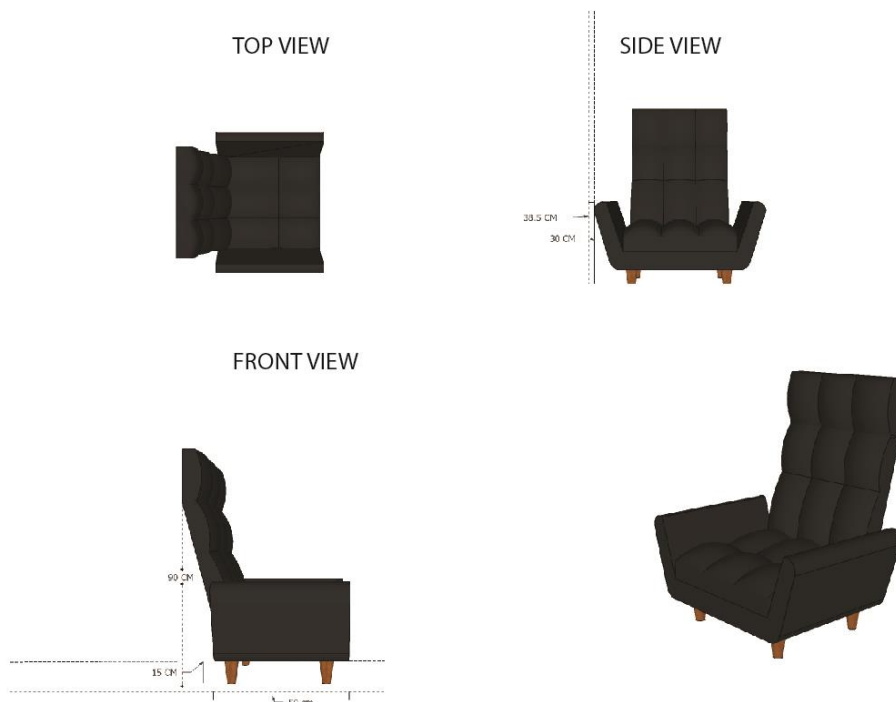
ภาพที่ 5 เฟอร์นิเจอร์อเนกประสงค์สำหรับพักผ่อน การเขียนแบบเพื่อการผลิต