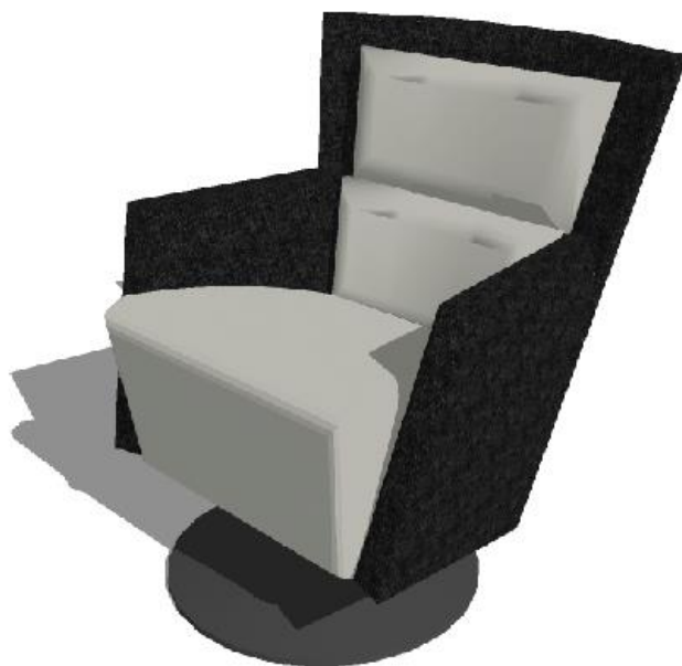
ภาพที่ 2 เฟอร์นิเจอร์อเนกประสงค์สำหรับการพักผ่อน รูปแบบที่ 2