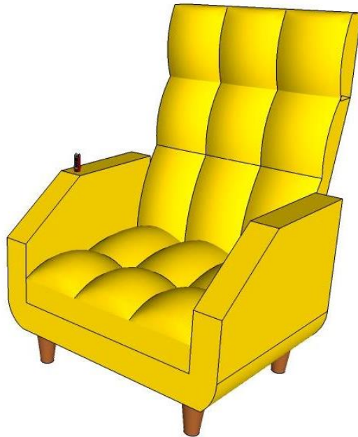
ภาพที่ 3 เฟอร์นิเจอร์อเนกประสงค์สำหรับพักผ่อน รูปแบบที่ 3

2. ผลการวิเคราะห์ข้อมูลการประเมินรูปแบบโดยผู้ทรงคุณวุฒิ ออกแบบเฟอร์นิเจอร์อเนกประสงค์สำหรับการพักผ่อน