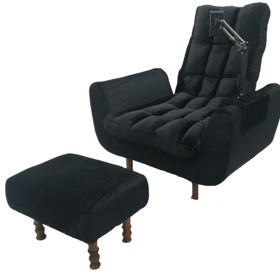
ภาพที่ 6 เฟอร์นิเจอร์อเนกประสงค์สำหรับพักผ่อน ต้นแบบที่ผ่านการผลิตจริง

3. ผลการวิเคราะห์ข้อมูลการประเมินความพึงพอใจ กลุ่มผู้บริโภค ที่มีต่อรูปแบบผลิตภัณฑ์เฟอร์นิเจอร์อเนกประสงค์สำหรับการพักผ่อน