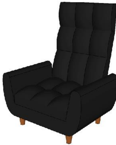
ภาพที่ 4 เฟอร์นิเจอร์อเนกประสงค์สำหรับพักผ่อน รูปแบบที่ 3 ที่ได้รับการปรับปรุงแก้ไข โดยผู้ทรงคุณวุฒิ

จากการสัมภาษณ์แบบมีโครงสร้าง ผู้วิจัยได้นำข้อเสนอแนะของผู้ทรงคุณวุฒิฯ นำมาปรับปรุงแก้ไขชิ้นงานรูปแบบที่ 3 ตามข้อเสนอแนะของผู้ทรงคุณวุฒิ และนำไปสู่กระบวนการผลิต และการประเมินความพึงพอใจ ดังนี้