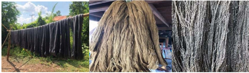
สีเทาใช้ลูกกระบก สีเหลืองใช้ใบตะเพียนหนู(ใบเหว)สีดำใช้ประดู่กระตุ้นด้วยน้ำสนิมเหล็ก

ไม้ชนิดอื่นย้อมแล้วได้สีตามต้องการยกเว้นเปลือกมะพร้าวที่มีปัญหาที่ไม่สามารถย้อมได้สีตามต้องการ ซึ่งในการย้อมแต่ละครั้งไม่ได้สีเหมือนเดิม สีที่ย้อมได้เป็นสีน้ำตาลส้มแต่สีที่ต้องการคือ สีชมพูเปลือกมะพร้าวที่ใช้ย้อมต้องเป็นเปลือกมะพร้าวน้ำหอมจากผลอ่อน เรียนรู้ต้นมะพร้าวที่ให้ผลมะพร้าวตามที่ต้องการต้องมีอายุ 5 ปีขึ้นไป ส่วนที่ต้องการจากเปลือกประดู่คือ สีน้ำตาลไหม้