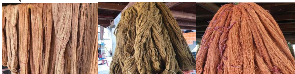
สีน้ำตาลเข้มใช้เปลือกสีเขียวใช้ใบสมอสีชมพูใช้ครั้ง

โดยสรุป การย้อมสีเส้นด้ายฝ้ายด้วยไม้ให้สีต่าง ๆ ดังนี้