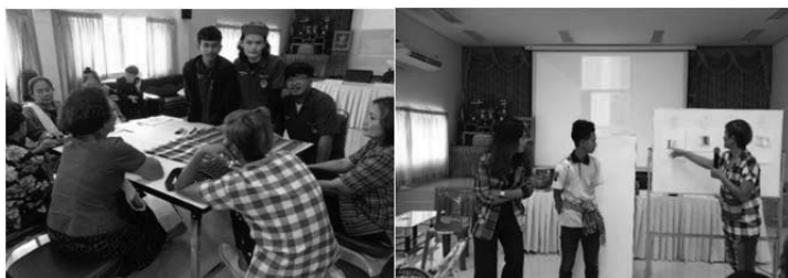
ภาพที่ 6 การวิเคราะห์ผลิตภัณฑ์และแนวคิดการจับคู่สี

กระบวนการสร้างองค์ความรู้ในด้าน การสร้างมโนทัศน์ด้านการออกแบบให้กับกลุ่มชุมชน กลุ่มชุมชนได้มีแนวคิดอย่างเป็นระบบ ผูกการ คิด วิเคราะห์ ผลิตภัณฑ์ การแตกยอดความคิดในแต่ละด้าน เพื่อให้กลุ่มชุมชนได้มีการเล็งเห็นความสำคัญ ของการวางแผนระบบพัฒนาผลิตภัณฑ์ เพื่อให้ให้เห็นปัญหาที่เกิดขึ้นกับผลิตภัณฑ์ในช่องทางต่างๆ การวิเคราะห์ แยกจุดเด่น จุดแข็ง และแนวทางการปรับปรุงพัฒนา การวิเคราะห์รูปแบบผลิตภัณฑ์เดิม การเจาะจงกลุ่มเป้าหมายทางการตลาดสู่การสร้างแรงบันดาลใจในการออกแบบผลิตภัณฑ์