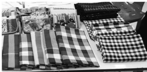
ภาพที่ 1 รูปแบบผ้าขาวม้าทอมือ

การลงพื้นที่เก็บรวบรวมข้อมูลด้านรูปแบบผลิตภัณฑ์ผ้าทอมือ โดยส่วนใหญ่ลวดลายผ้าขาวม้าทอมือที่ทางกลุ่มผ้าทอมือผลิตขึ้นมานั้น ส่วนใหญ่เป็นลายตารางมีชื่อเรียกว่า ผ้าขาวม้าลายตาหมูแบบโบราณ ผ้าขาวม้าลายผ้าขาวม้าตามะกอก ผ้าขาวม้าลายตาเล็ก และทางกลุ่มมีความต้องการที่จะพัฒนาในด้านของรูปแบบที่ตรงต่อความต้องการลูกค้าในปัจจุบัน ที่ขายเพียงผ้าขาวม้าแบบเป็นผ้าผืน กระเป๋าสตางค์ กระเป๋าสะพาย และรูปแบบเสื้อซาฟารี