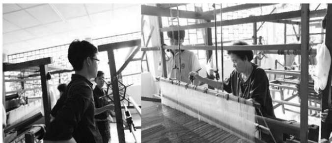
ภาพที่ 2 กี่ทอผ้าขาวม้าทอมือ

การใช้เครื่องทอผ้าทำให้เป็นผืนยาว โดยส่วนใหญ่จะใช้เส้นด้ายสีพื้นเป็นเส้นตั้งในอนอนยาว และใช้ด้ายสีที่เป็นกระสวยเป็นเส้นแนวขวาง เพื่อทำให้สีของลายผ้าขาวม้ามีลวดลายขึ้น โดยสีที่ติดกันนั้น จะมีสีที่เข้มมากยิ่งขึ้น การทอผ้าขาวม้าส่วนใหญ่จะใช้ไม่เกิน 3 สี ในการทำให้เกิดลวดลายของผ้าขาวม้าทอมือ