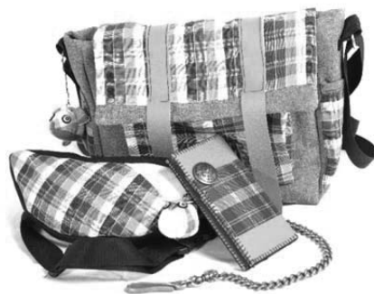
ภาพที่ 4 ผลิตภัณฑ์ต้นแบบจากผ้าขาวม้า