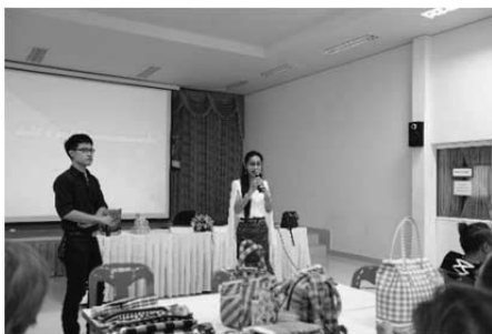
ภาพที่ 5 การจัดการถ่ายทอดองค์ความรู้ด้านการออกแบบ

จากกระบวนการถ่ายทอดองค์ความรู้สู่ชุมชน กลุ่มชุมชนให้ความสนใจในด้านการส่งเสริมการเรียนรู้สู่กระบวนการพัฒนาผลิตภัณฑ์ ในการสร้างแนวทางการจัดการองค์ความรู้ด้านการออกแบบและแนวทางการพัฒนาผลิตภัณฑ์ในรูปแบบต่างๆ ได้ร่วมกันหาแนวทางการพัฒนาต่อยอดความรู้ เป็นการเปิดโลกทัศน์และมุมมองของกลุ่มชุมชน ถึงแนวทางการพัฒนาต่อยอดสินค้าภายในกลุ่มชุมชน กลุ่มมองหากลุ่มเป้าหมายทางการตลาดก่อนผลิตลดทุน การเลือกใช้วัสดุแบบผสมผสาน เพื่อสร้างความน่าสนใจให้กับสินค้า สร้างจุดเด่นให้กับผลิตภัณฑ์จุดสนใจ สู่ท้องตลาดอย่างยั่งยืน