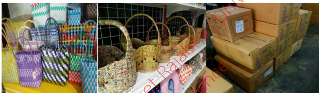
ภาพที่ 3(b) การจัดการคลังสินค้าแบบใหม่ (แบบเอบีซี)

จากการสัมภาษณ์กลุ่มตัวอย่างหลังจากที่มีการพัฒนาการจัดลำดับสินค้าด้วยทฤษฎี ABC Analysis ดังต่อไปนี้