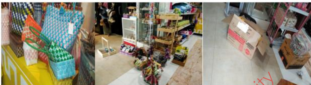
ภาพที่ 3(a) การจัดการคลังสินค้าแบบเดิม