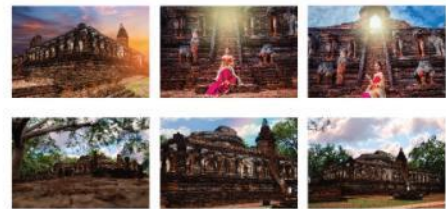
ภาพที่ 5 ภาพถ่าย 6 ภาพ จากสถานที่ท่องเที่ยว วัดช้างรอบ