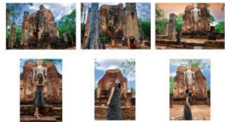
ภาพที่ 7 ภาพถ่าย 6 ภาพ จากสถานที่ท่องเที่ยว วัดพระสี่อิริยาบถ