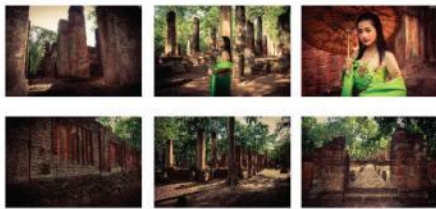
ภาพที่ 4 ภาพถ่าย 6 ภาพ จากสถานที่ท่องเที่ยว วัดพระนอน