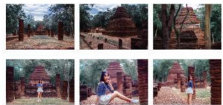
ภาพที่ 9 ภาพถ่าย 6 ภาพ จากสถานที่ท่องเที่ยว วัดกำแพงงาม