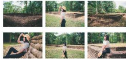
ภาพที่ 13 ภาพถ่าย 6 ภาพ จากสถานที่ท่องเที่ยว สระมน