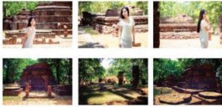
ภาพที่ 10 ภาพถ่าย 6 ภาพ จากสถานที่ท่องเที่ยว วัดช่องชัย