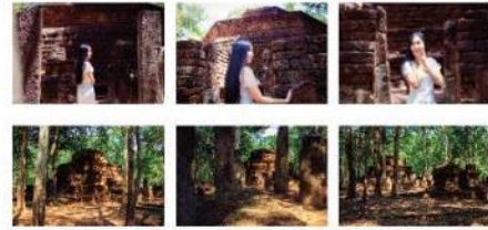
ภาพที่ 11 ภาพถ่าย 6 ภาพ จากสถานที่ท่องเที่ยว วัดนาคเจ็ดเศียร