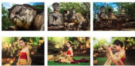
ภาพที่ 2 ภาพถ่าย 6 ภาพ จากสถานที่ท่องเที่ยว วัดพระแก้ว

ผลการสัมภาษณ์แบบมีโครงสร้าง พบว่า ผู้เชี่ยวชาญด้านการถ่ายภาพทั้ง 3 ท่าน มีความเห็นสอดคล้องกันว่า ควรพิจารณารูปภาพจากหลักขององค์ประกอบทางศิลปะ และหลักการทางศิลปะ ที่มีความเหมาะสม เนื่องจากบางรูปภาพมีการถ่ายด้วยองค์ประกอบที่แตกต่างกันไป ดังนั้นรูปแบบของภาพถ่ายที่เหมาะสมต่อการส่งเสริมการท่องเที่ยวตามหลักการที่ผู้วิจัยกำหนดไว้ จะต้องสอดคล้องกับหลักการและองค์ประกอบการถ่ายภาพมากที่สุด ซึ่งจากการคิดสรรโดยผู้เชี่ยวชาญด้านการถ่ายภาพ จึงได้ภาพถ่ายที่เหมาะสมตามองค์ประกอบและหลักการทางศิลปะทั้งหมด 6 ภาพถ่าย ต่อ 1 สถานที่ รวมทั้งหมด 12 สถานที่ ดังนี้