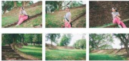
ภาพที่ 12 ภาพถ่าย 6 ภาพ จากสถานที่ท่องเที่ยว กำแพงเมืองและป้อมประตู