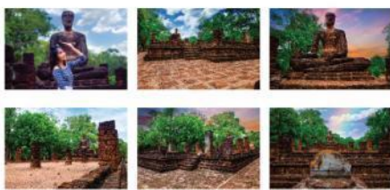
ภาพที่ 6 ภาพถ่าย 6 ภาพ จากสถานที่ท่องเที่ยว วัดสิง