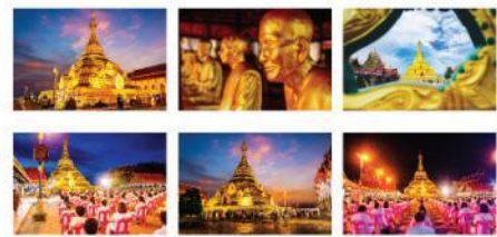
ภาพที่ 3 ภาพถ่าย 6 ภาพ จากสถานที่ท่องเที่ยว วัดพระธาตุ