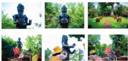
ภาพที่ 8 ภาพถ่าย 6 ภาพ จากสถานที่ท่องเที่ยว ศาลพระอิศวร