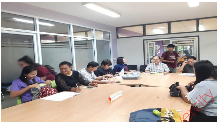
ภาพที่ 3: การประชุมทีม Node กำแพงเพชร เพื่อติดตามผลลัพธ์โครงการส่งเสริมสุขภาพชุมชนโดยทีมประเมินจาก มหาวิทยาลัยราชภัฏอุดรดิตต์ ณ มหาวิทยาลัยราชภัฏกำแพงเพชร วันที่ 30 กันยายน 2561