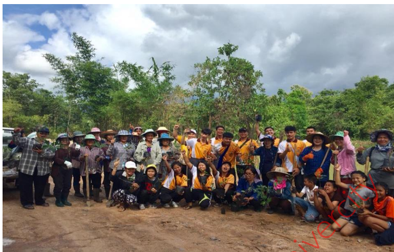
ภาพที่ 4: การร่วมกิจกรรมส่งเสริมการปลูกป่าระหว่างนักศึกษาและชุมชน “ค่ายอาสา เพื่อพัฒนาแกนนำนักศึกษา” ณ บ้านแม่มอก อำเภอลาดบัวหลวง จังหวัดลพบุรี