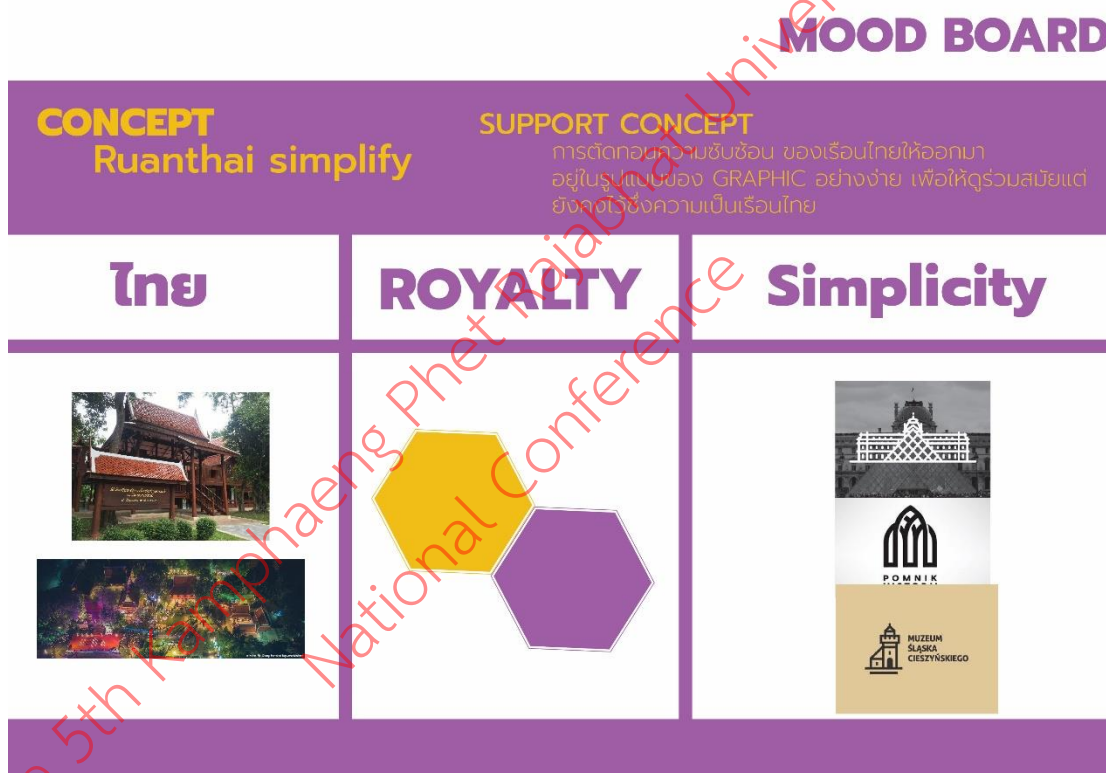
ภาพที่ 1 mood board แสดงแนวคิดเบื้องต้นในการออกแบบตราสัญลักษณ์และอัตลักษณ์พิพิธภัณฑ์สถานจังหวัดกำแพงเพชร เฉลิมพระเกียรติ

ผู้วิจัยได้วิเคราะห์ข้อมูลที่ได้จากการสัมภาษณ์ เพื่อใช้เป็นแนวทางในการออกแบบ และได้ออกแบบตราสัญลักษณ์จำนวน 4 รูปแบบ โดยให้มีลักษณะเรียบง่าย ใช้สีหลักเป็นสีม่วง และสีตัวอักษรเป็นสีเหลือง และใช้ตัวอักษรรูปแบบ CRU-rajabhat ที่เป็นตัวอักษรประจำมหาวิทยาลัยราชภัฏ เพื่อให้มีความเชื่อมโยงกับมหาวิทยาลัยราชภัฏกำแพงเพชร และนำตราสัญลักษณ์ที่ได้ไปให้ผู้เชี่ยวชาญประเมินรูปแบบเพื่อหารูปแบบที่เหมาะสมที่จะใช้ในการออกแบบตราสัญลักษณ์และอัตลักษณ์องค์กร พิพิธภัณฑ์สถานจังหวัดกำแพงเพชร เฉลิมพระเกียรติ